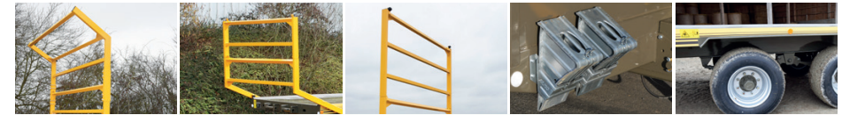
PEUT ÊTRE MONTÉ À TOUT MOMENT