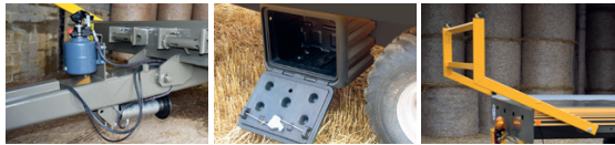
PEUT ÊTRE MONTÉ À TOUT MOMENT